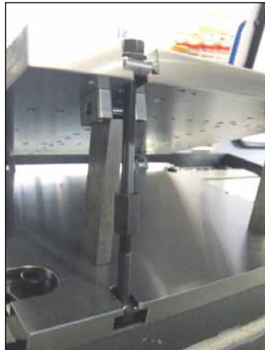
4 – fach fixierbar (vorne und hinten), was auch Schruppbearbeitungen ermöglicht