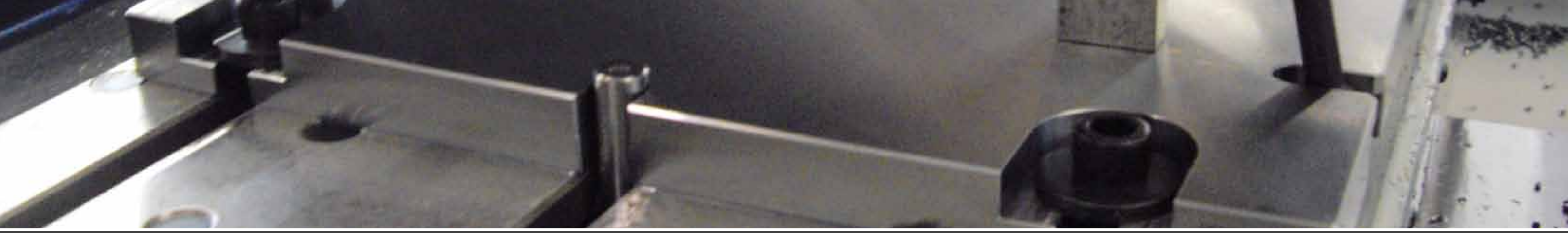
Grundplatte mit Spann- und Zentriernuten (abgestimmt zu Ihrer Maschine)