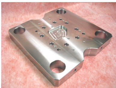
Stanzwerkzeugoberteil aus Toolox 44

TOOLOX 44 ist ein neuer gehärteter Werkzeugstahl mit hoher Zähigkeit und sehr geringer Restspannung für gute Formstabilität. Durch seine Härte von 45 HRC (im Anlieferzustand) und die hohe Warmfestigkeit eignet er sich zur Herstellung von Formwerkzeugen, z.B. Kunststoff-, Gummi-, Druckgussformen, Abkant- und Blechumformwerkzeuge. Durch geeignete Oberflächenbehandlung läßt sich die Standzeit des Werkzeugs oder der Komponente erheblich verlängern.